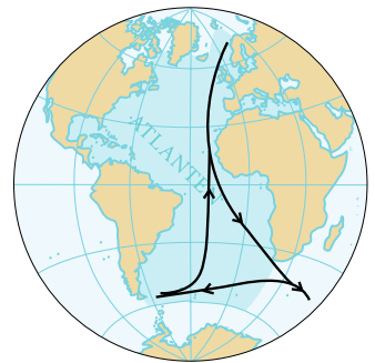
SILVERTÄRNORNAS FLYTTVÄG ÖVER ATLANTEN

DEN TOTALA STRÄCKAN tur och retur blir cirka 35 000 km, kanske upp till 40 000 km, att jämföra med jordens omkrets på 40 000 km. Om silvertärnan dessutom gör längre förflyttningar nere i Antarktis kan sträckan givetvis bli ännu längre, men satellitsändarna är ännu för tunga för denna ungefär 100 g lätta tärna så definitiva bevis saknas. Det finns dock återfynd av silvertärnor i Australien av silvertärnor ringmärkta i Europa och detta indikerar att en rörelse sker