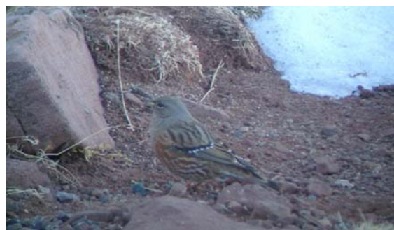
Alpjärnsparv. En av hela tolv exemplar vid telemasten Oukaimeden.

3 ex 16.11 Gorges du Dades, 1 ex 21.11 Oued Massa, 2 ex 24.11 Merdja Zerga, 1 ex 25.11 Oued Loukkos, 1 ex 26.11 + 2 ex 27.11 norr om Oukaimeden.