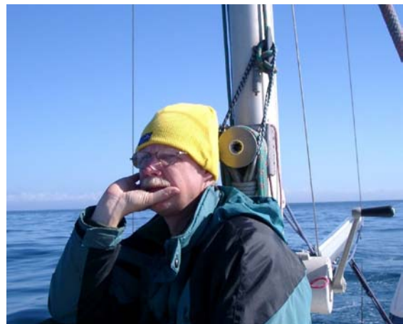
Drömmer om vita övergumpar... Grindlund på havet.

123. Båglärka Alaemon alaudipes 1 ex 16.11 Tagdilt Track, 2 ex 16.11 Tagdilt - Jorf,