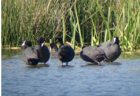
Många. Kamsotöns vid Oued Loukkos.

150 ex 23.11 Oualidia - Sidi Moussa, 10 ex 25.11 Oued Loukkos, 300 ex 25.11 Merdja Zerga, 10 ex 25.11 Oued Sous.