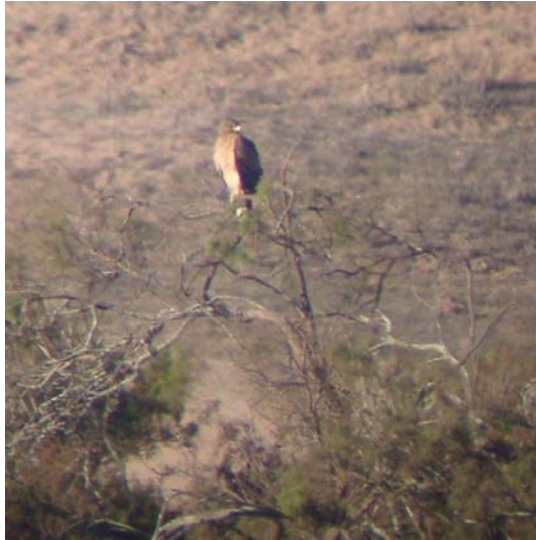
Hökörn. En ungfågel satt på span vid Oued Massa.

1 IK 19.11 mellan Taroudannt och Aoulouz, Sousdalen, 1 IK 21.11 Oued Massa, 1 ad 27.11 2 mil S Marrakech.