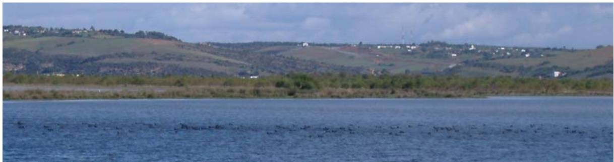
Översvämmat. Vid Oued Loukkos fanns svarta band av sothöns, mest kamsothönor!

25 november: Regnet tycks ha pågått hela natten, så när vi kl. 5.30 samlas i matsalen för frukost, finns där ännu fler pölar. Några har sett kackerlackor och ödlor på rummen. Strax före kl. 7 i ljusningen startar vi mot norr och gläds åt, att molnen verkar lätta. Mitt på vägen står kohägrar. Nu blir det i alla fall färd på motorvägen till Larache. Vinden i området tycks ha varit mycket kraftig, eftersom där ligger knäckta eucalyptusträd. Efter att ha