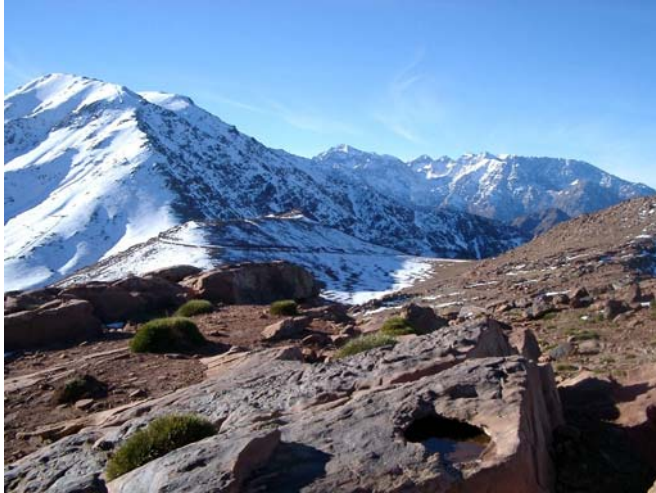
Resans höjdpunkt. Oukameiden med den mer än 4000 meter höga Jebel Toubkal i bakgrunden