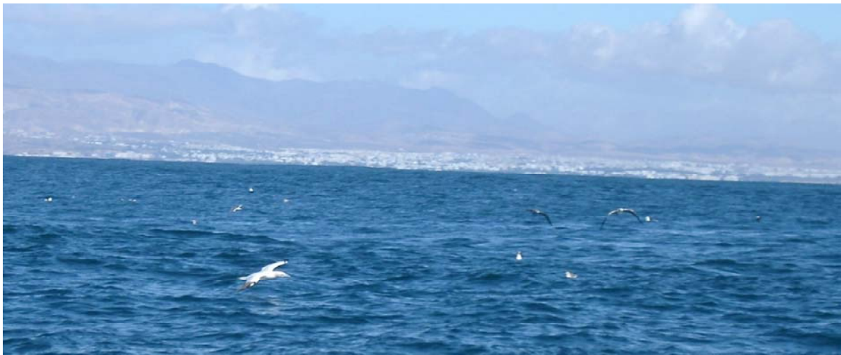
Havssulor, trutar och lror... Havsfåglar med Agadir i bakgrunden.

Efter 3 timmars gång långt ut på havet kommer en sädesärsla över båten! Strax efteråt dyker en havssköldpadda upp, och vi kretsar runt den. Sedan stängs motorn av, och det blandas ”chum” – popcorn, matolja och fiskrens – som slängs ut för att locka fåglar och fiskar. Tyvärr verkar den inte vara tillräckligt inbjudande, men ännu en havssköldpadda visar sig en stund senare. Till lunch får vi bröd med kycklingsallad inuti och vin att dricka.