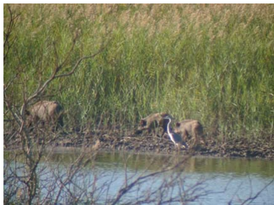
Vildsvin. Vid Oued Massa skymtade tre vildsvin, hona med två kultingar. I vägen står en gråhäger.