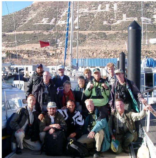
Glada och förväntansfulla inför båtskåning. Marockogänget med båtbesättning i Agadirs hamn.

När vi ser en hökörn sittande på en kraftledningsstolpe, är det dags för nästa stopp, som dessutom ger oss både gulhämpling och en bofink -flock. Vid Oulad Aissa stannar vi för att beundra en ryttlande svartvingad glada. Den fångar något, som den flyger med till en stolpe och åter upp. Under vägen mot Agadir ser vi sedan ytterligare fem