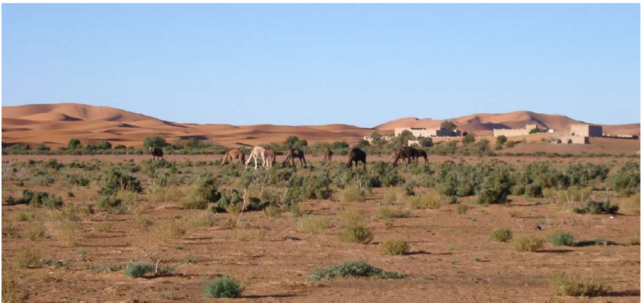
Revir för ökensparv. Dromedarer, Café Yasmina och Erg Chebbi.

Innan solen går upp alldeles före kl. 7 upptäcker vi siluetter av folk på mest varje sanddyn runt horisonten.