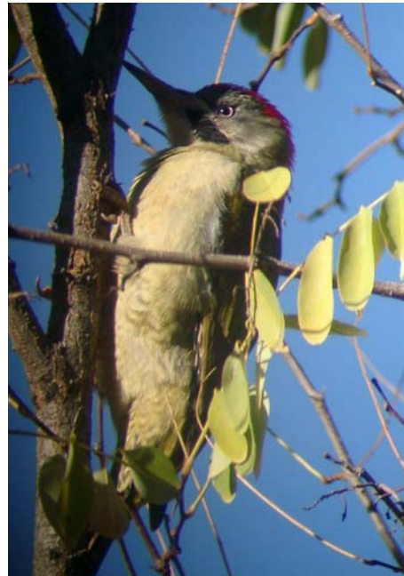
Atlasgröngöling vid Oukameiden. Atlasbergen den 26 november 2002.

Särskilt anmärkningsvärt var våra savannörnar som sågs i det inre av Sousdalen, på en plats där arten setts vid flera tillfällen de senaste åren. Ökenlöpare är en art som anses som svår under vintermånaderna men som vi också fick se. Bra övervintringsområde tycks vara norr om Marrakech.