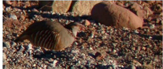
Kamouflagefärgad. Klipphöna vid Oukaïmeden.

Oukaïmeden, 1 ex nedanför 27.11 Oukaïmeden, 4 ex 28.11 Oued Sous.