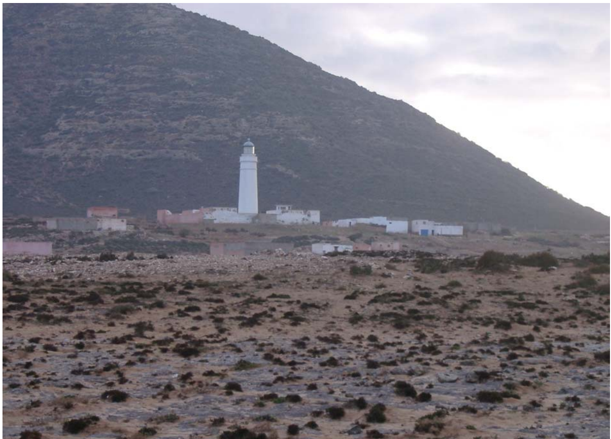
Cap Rihr. Klassisk marockansk havsfågellokal med fyren och samhället i ”ryggen”.

För att hinna till Safi före skymningen måste vi tyvärr lämna denna intressanta plats. Längs vägen ser vi 4 korpar, en hämplingflock, kohäger och många svarta starar. Vi tar in på Hotel Safir, Safis finaste, där kungen sägs ha varit på besök nyligen. Före artgenomgången hinner vi gå ut till poolen och se ut över havet och de upplysta fartygen på redan. Fyra obestämda tornseglare far runt under livligt sirrande, medan bulbyler, koltrastar och rödhakar hörs bland buskarna. Middagen består av en varm, god soppa, kycklingklubba och som efterrätt någon sorts söt mannagrynspudding. Vi får dessutom dadlar, fikon och andra sötsaker.