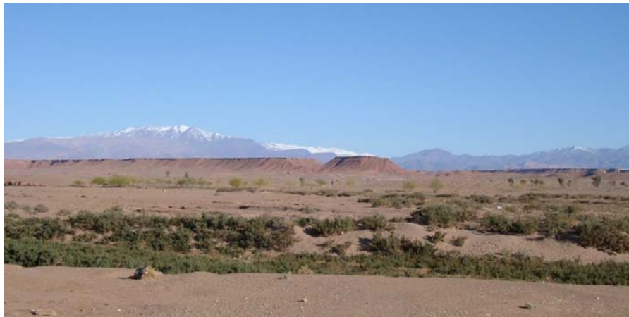
Vanlig vägkantvy. Slätten vid Tazenakht med Atlasbergen i bakgrunden.