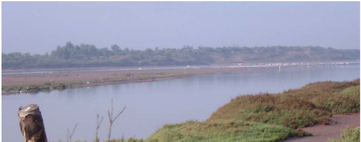
Från plattformen vid Oued Sous. Sandbank och måsfågel.

Morgondimman hindrar oss inte att höra men att se strandskator, trutar, flamingor, skogssnäppor, sammetshättor, ängspioplärkor, gransångare och koltrastar, när vi vandrar en dålig körväg mot havet. När solen går upp, lättar också dimman. Fyra klipphönor flyger upp och ses sedan också på vägen. Vi ser ringduvor, gråssångare, gråhäger och gråsparvar men vänder ganska snart åter mot bussen, som tar oss 500 m uppströms,