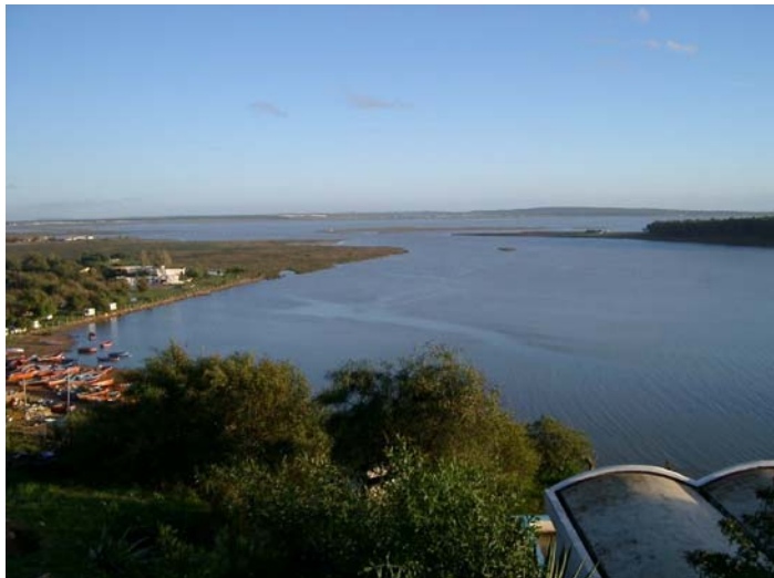
Utsikt från hotell Le Lagon i Moulay Bouselham. I bakgrunden ses Merdja Zerga och campingen med kapugglor (till vänster).