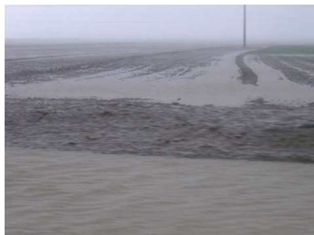
I skydd av bilfönster. Åker och oväder fotograferat i farten.

Vid bron över Oued Sous strax före staden Taroudannt stannar vi för en första skådning. Vattnet forsar förbi, det är alldeles rödbrunt och fullt med slam. Blåsten tar i rejält, men vi slipper regnet en stund och hinner se bl.a. ett par obestämde tornseglare , blåmes och trädgårdsbulbyler på nära håll samt diademrödstjärt . På långt håll syns en svartvingad glada .