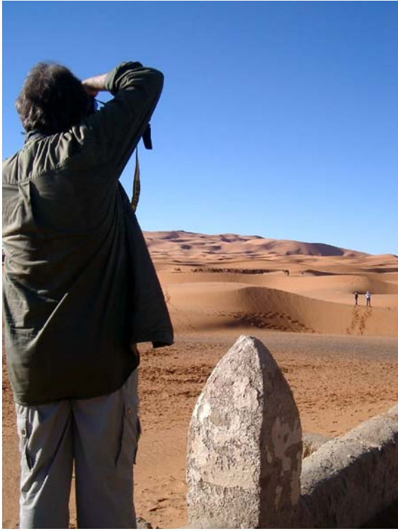
Acke med sanddynor. Vid Erg Chebbi ges stora möjligheter till fotografering.

På väg in mot Erfoud ser vi stora pölar. Även här i kanten av Sahara har det tydligt regnat rejält. Många intressanta ouedder lockar, men nu i skymningen är det bara hotellet som gäller, och vi är snabbt framme vid Hotel Kasbah Tizimi, ett stort palats. Det visar sig vara uppfört av och för Främlingslegionen, och man kan bl.a. se en Rotary-skylt. Efter artgenomgången serveras vår middag med dadelpaj som efterrätt. Vår långa och intressanta dag tar ut sin rätt, och det är skönt att få somna direkt efter maten.