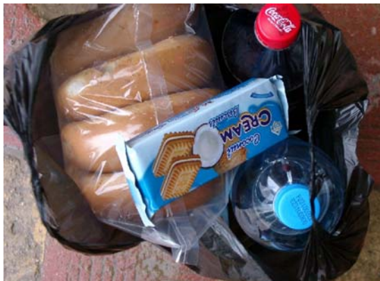
Vanligt inköp för en Marockoskådare.