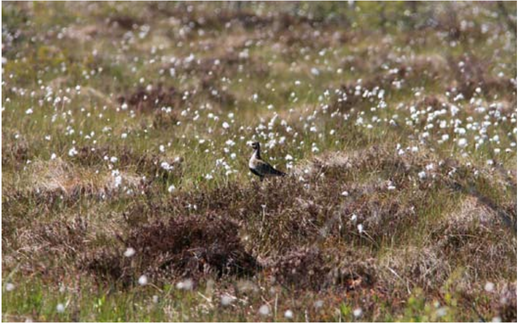
Florarna har en spännande häckfågelfauna. De öppna myrarna håller åtminstone vissa år både stor-spov, grönbena och ljungpipare vilket är mycket exklusivt för att vara Uppland. Ljungpipare, Pluvialis apricaria , Hillebolamossen i juni 2009.

de flesta arterna. Det innebär att man måste avsätta lång tid om man ska få något ornitologiskt utbyte av ett besök. Området är med andra ord inget för så kallade artkryssare. Det kräver också att man gillar friluftsliv och har ett allmänt naturintresse med dragnig åt orörda, väglösa landskap – alltså en naturtyp som vi förknippar med naturen längre norr ut. De som lägger ner, minst fem timmar från gryningen brukar likafullt ofta känna sig nöjda.